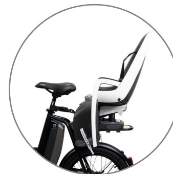
Kindersitz Befestigung am Gepäckträger