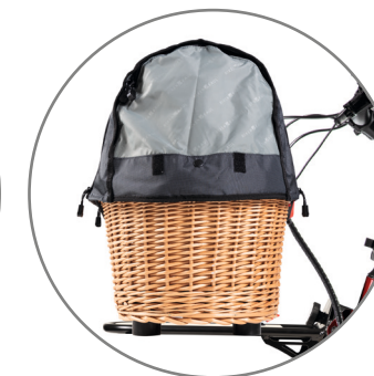
Hundekorb Belastbar bis 8 kg. Schutzgitter