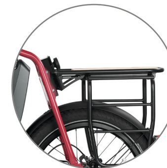
Taschenhalter Befestigung am Gepäckträger