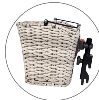
Einkaufskorb Korb mit Klick-Fix Adapter